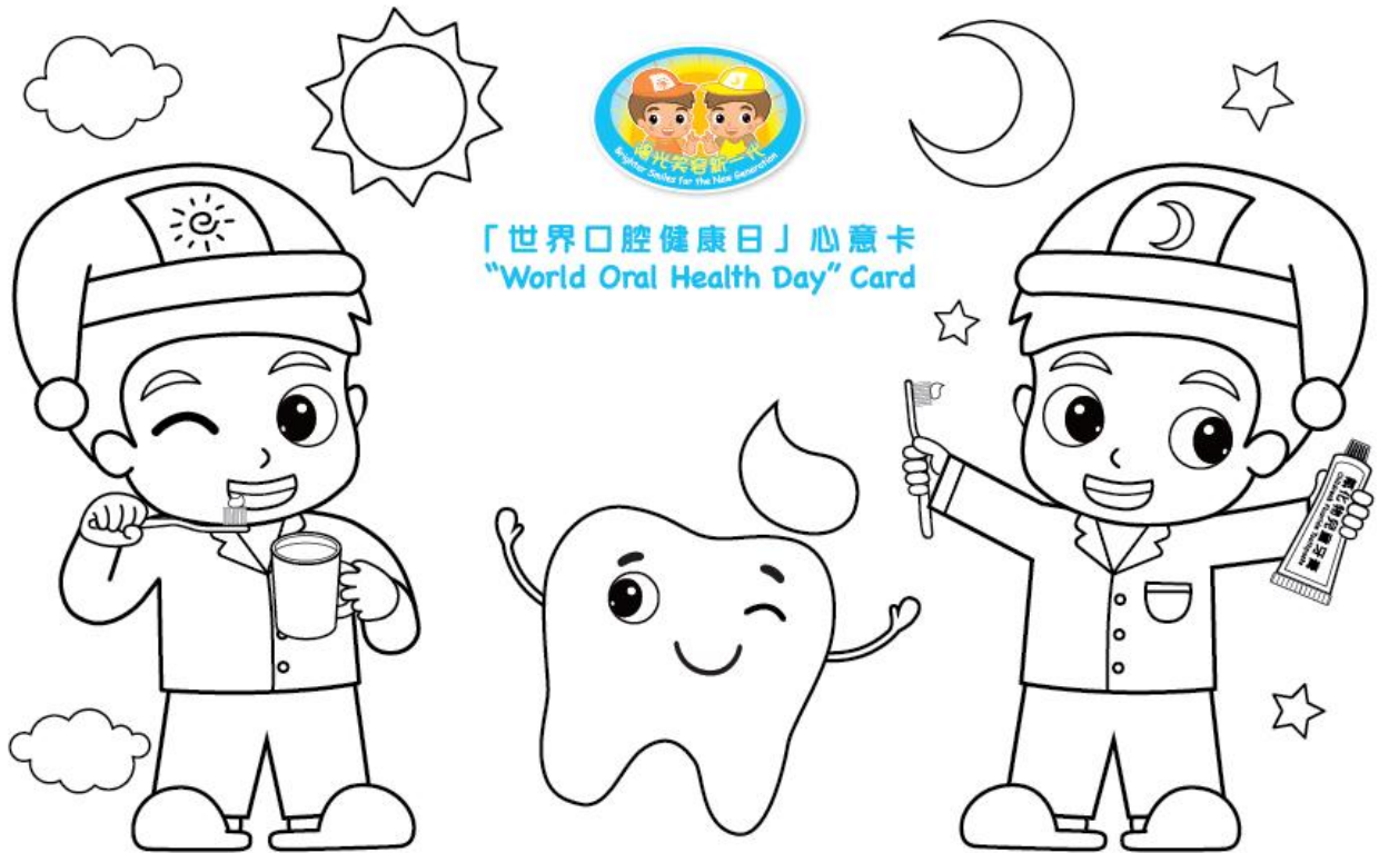
「世界口腔健康日」心意卡 "World Oral Health Day" Card