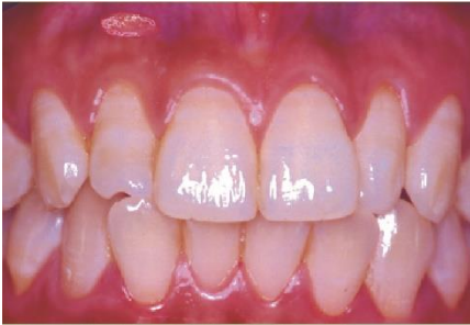
Sariawan muncul pada gusi

Sariawan adalah salah satu bentuk ulkus mulut yang cenderung bersifat kambuhan. Sariawan biasanya muncul pada jaringan lunak dalam rongga mulut, termasuk mukosa pipi, bibir, dan tenggorokan, serta permukaan lidah. Sariawan tidak menular.