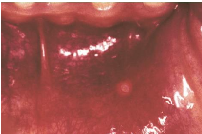
Sariawan muncul pada bibir

Sariawan awalnya berbentuk bulat atau lonjong. Dalam sehari berubah menjadi ulkus yang memutih dengan pinggiran merah. Kadang-kadang terasa sakit!