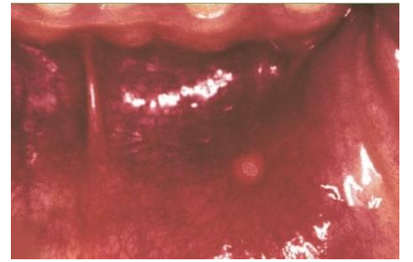
منہ کا السر ہونٹ پر ہو جاتا ہے

منہ کا السر ابتدائی طور پر گول یا بیضوی شکل کا ہوتا ہے۔ ایک دن میں یہ سرخ دانوں کے ساتھ سفید السر بن جاتا ہے۔ بعض اوقات یہ بہت تکلیف دیتا ہے!