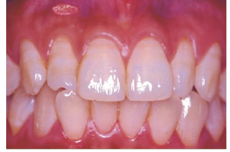
منہ کا السر مسوڑوں میں ہوتا ہے

یہ منہ کا السر حال ہی میں میرے منہ کے کھوکھلے پن میں ظاہر ہوا ہے۔ یہ کیا ہیں؟ یہ منہ کے السر کی ایسی قسم ہے جو دوبارہ ہو جاتی ہے۔ یہ منہ کے کھوکھلے پن کے نرم ریشوں پر ظاہر ہوتا ہے جس میں گالوں، ہونٹوں اور گلے نیز زبان کی سطح پر لعابی جھلی بن جاتی ہے۔ یہ غیر متعدی ہوتا ہے۔